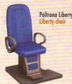
Paltrona Liberty Liberty chair