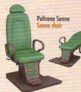
Paltrona Sonne Sonne chair