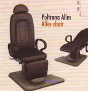
Paltrona Alles Alles chair