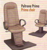
Paltrona Prima Prima chair